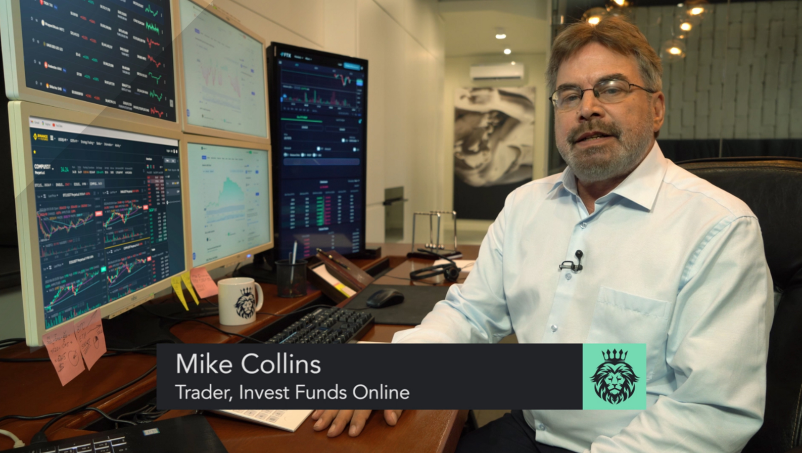
Mike Collins Trader, Invest Funds Online